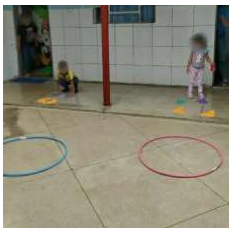
Imagem 2 – Circuito