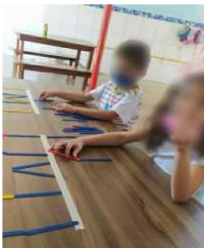
Imagem 3 – Atividades coordenação motora fina