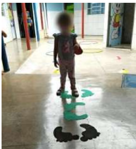
Imagem 1 – Travessia das pegadas

A brincadeira número 1 (imagem 1) é a travessia pelas pegadas. Basicamente, as pegadas de papel são colocadas no chão e os alunos devem segui-las.