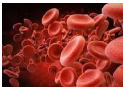
Figura A: Hemácias ou Eritrócitos normais