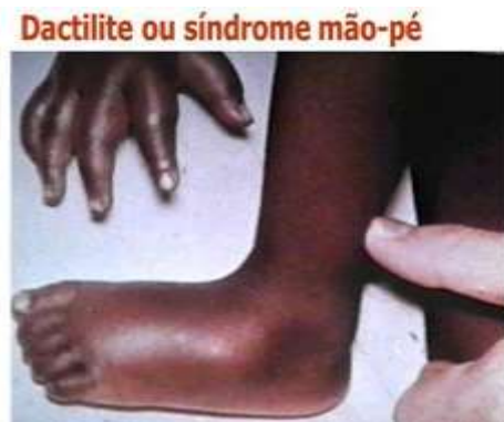
Figura C: Síndrome do Pé e Mão