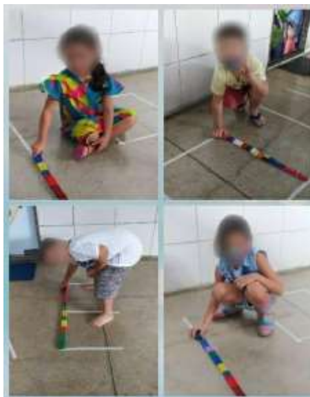
Imagem 4 – Atividades coordenação motora fina

Já na atividade número 4, as crianças devem posicionar pecinhas sobre a linha demarcada no chão, conforme registrado na imagem a seguir: